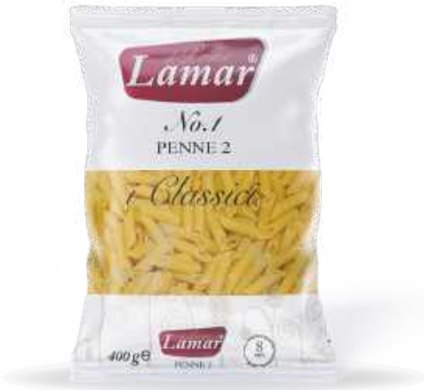
Penne 12 400g