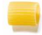
Pâtes DITALINI Pasta Ditalini