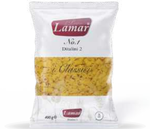
Ditalini 23 400g