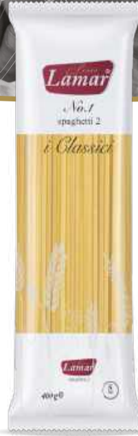
Spaghetti 12 400g